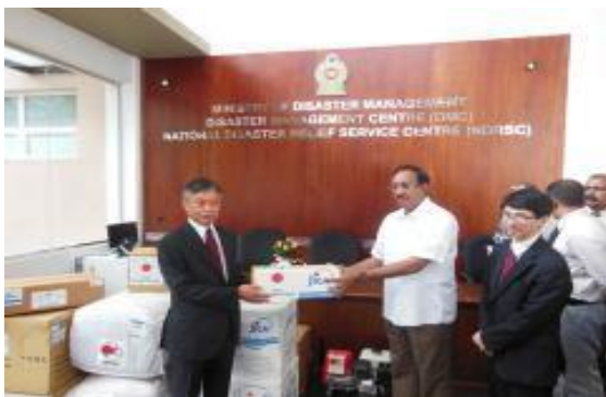
ජපන් තානාපතිතුමන් විසින් ගරු ආපදා කළමනාකරණ අමාත්‍යතුමන් වෙත සහනාධාර ද්‍රව්‍ය භාර දුන් අවස්ථාව