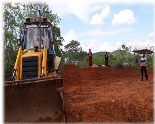
බිම් සකස් කිරීමේ කටයුතු