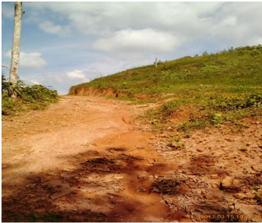
ජාතික ගොඩනැගිලි පර්යේෂණ ආයතනයෙන් නිර්දේශ කරන ලද නිවාස ඉදිකිරීම සඳහා තෝරාගත් ඉඩම්

අධි ආපදා අවදානම් ස්ථානවල පිහිටා තිබූ පූර්ණ ලෙස නිවාස හානිවූ ජනතාව සඳහා නිවාස ඉදිකිරීමේ වැඩසටහන