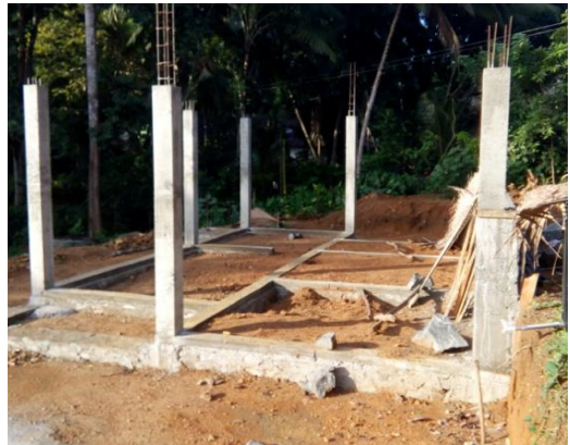
නිවාස ඉදිකිරීමේ කටයුතු