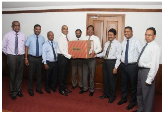
NEXT PLC ආයතනය මගින් ගරු ආපදා කළමනාකරණ අමාත්‍යතුමන් වෙත සහනාධාර ද්‍රව්‍ය භාර දුන් අවස්ථාව

ජාතික ආපදා සහන සේවා මධ්‍යස්ථානය විසින් රටවල් විශාල ගණනාවකින් ලබා දෙන ලද විදේශාධාර කටයුතු නිශ්කාශනය කරන ලද අතර මධ්‍යස්ථානය සතු ඔරුගොඩවත්ත අංක 07 ගබඩාවෙහි විදේශවලින් ලත් භාණ්ඩ සහ ආධාර ගබඩා කරන ලදී. ආධාර තොග 48 ක පමණ නිශ්කාශනය කරන ලද අතර ඒ සඳහා රු. 2,503,949.83 ක මුදලක් වැය කරන ලදී.