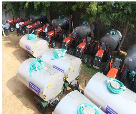
2016.11.09 දින නියඟයෙන් පීඩාවට පත් ජනතාවට ට්‍රැක්ටර් බවුසර් ලබා දීම