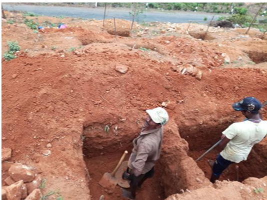
නිවාස ඉදිකිරීමේ කටයුතු